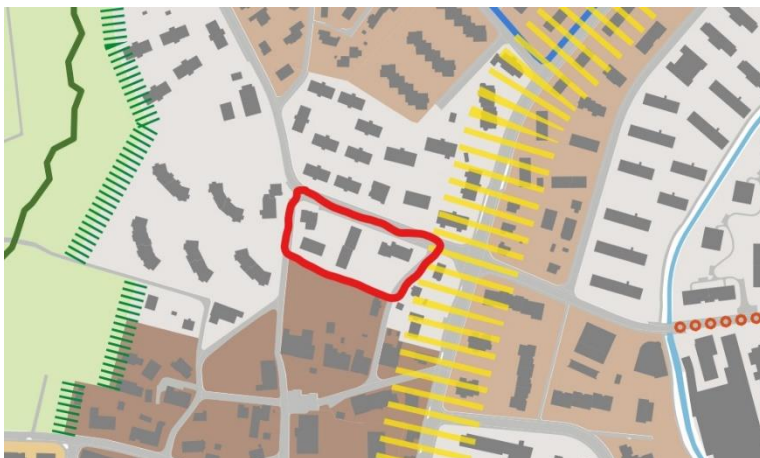
Ausschnitt Leitbild 2021 mit roter Gebietsmarkierung

Die Mehrheit der Plako-Mitglieder spricht sich für diese Anpassung aus.