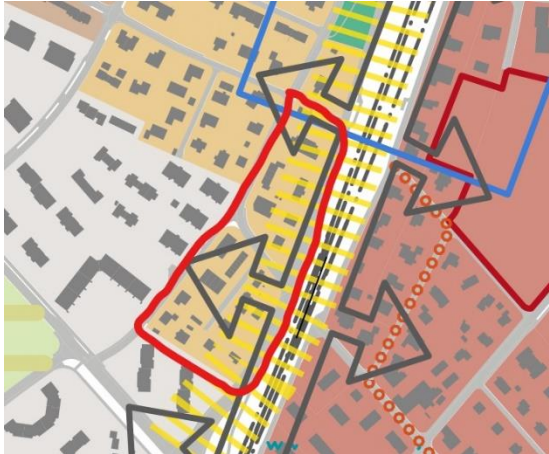
Ausschnitt Leitbild 2021 mit roter Gebietsmarkierung